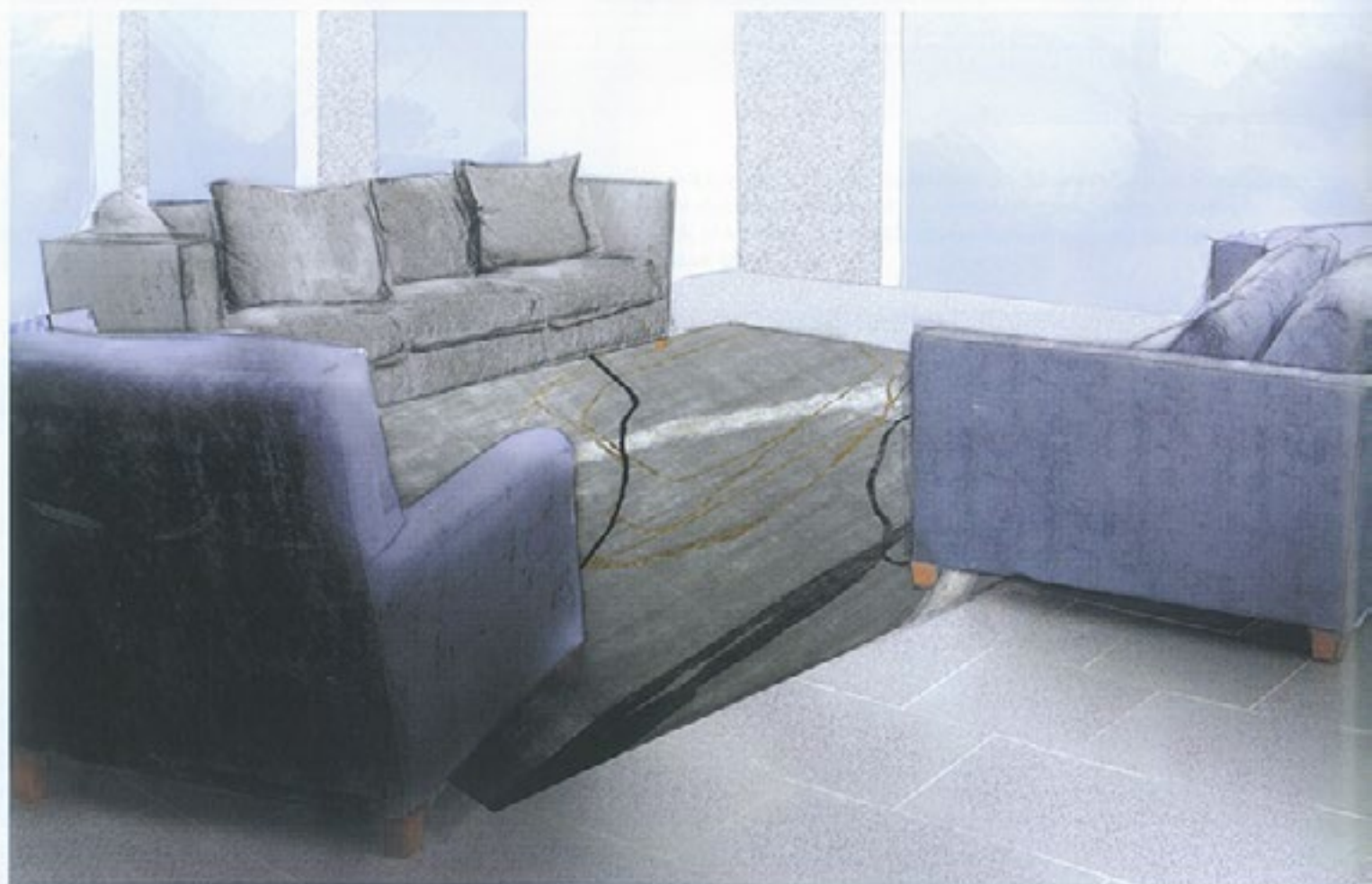
En haut : le tapis du projet une fois tissé. Qualité Naggpur, nœuds tibétains serrage 100 000, velours 100 % soie. Ci-dessous : simulation du tapis dans la pièce.